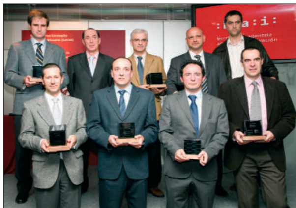
Entrega de reconocimientos en el 5º Aniversario de la Vigilancia Tecnológica y la Inteligencia Competitiva de Bizkaia

Una vez superada la implantación de Premie, de los sistemas de calidad, medio ambiente y prevención, y tras una reflexión estratégica importante por parte de la dirección de la empresa, se comienzan a dar los