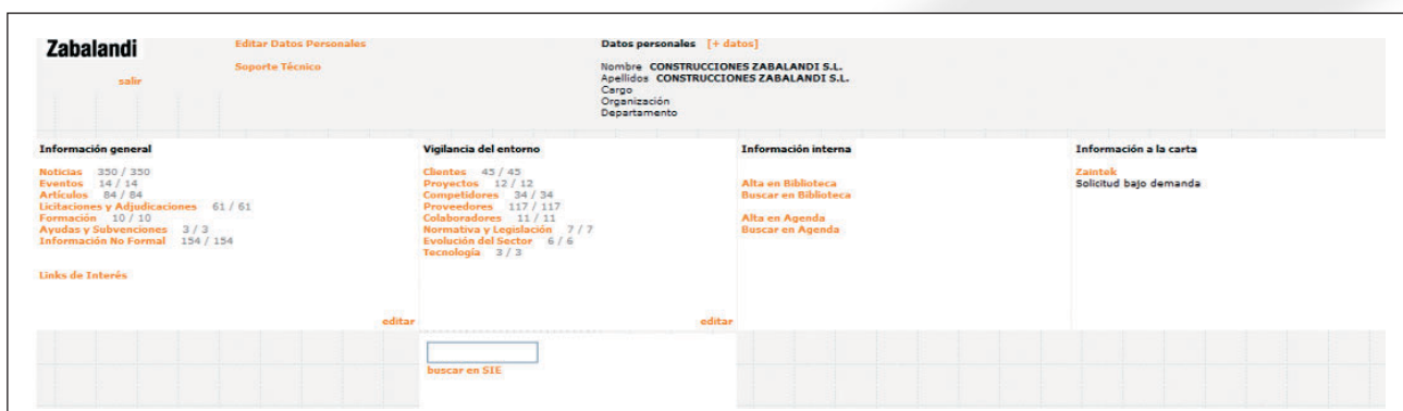
Figura 1. Sistema de Información Empresarial de Construcciones Zabalandi

La información y correcta gestión de ésta, constituye un valor añadido para nuestros clientes y una ventaja competitiva frente a nuestros competidores, por lo que la organización toma la decisión de implantar un "sistema de información empresarial, SIE".