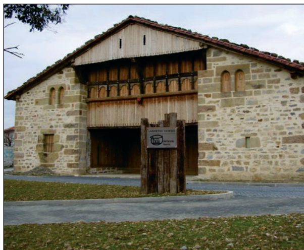
Reforma del caserío Landetxo Goikoa. Ayuntamiento de Mungia. Bizkaia

En noviembre de 2008 hemos llevado a cabo un Contraste Externo por parte de Euskalit, con unos resultados muy satisfactorios. La realización de dicho contraste externo ha supuesto una importante actividad de aprendizaje para la empresa, obteniendo el Diploma de Compromiso.