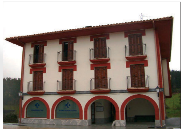
Viviendas y consultorio médico. La Villa, Errigoiti. Bizkaia

En el año 2002, considerando a nuestros clientes como un activo fundamental de la organización, la empresa considera prioritario lograr la plena satisfac-