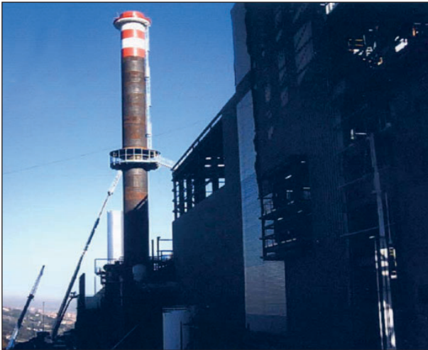
Cimentación de la chimenea incineradora Zabalgardi. Bizkaia

ción de sus expectativas y necesidades. La empresa toma conciencia de que la responsabilidad de la obtención de la calidad alcanza a todas las personas integrantes de la organización. Fieles a estos principios, la dirección de Construcciones Zabalandi, toma la decisión de crear, implantar y mantener en todos los niveles de la organización un sistema de gestión de calidad, basado en la aplicación de norma UNE-EN ISO 9001:2000. En el año 2002, dentro de la convocatoria Eraikal Dos (1999-2001) y con la colaboración de Ascobi, obtuvimos la certificación con Aenor de la UNE-EN ISO 9001:2000.