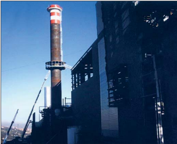
Zabalgarbi (Bizkaia) errauskailuaren tximiniako zimenduak jarri

Enpresa berehala ohartu zen kalitatea lortzeko funtsezkoa zela erakundeko kide guztiak inplikatzeko. Aipatutako printzipio guztiak abiapuntutzat hartuta, Construcciones Zabalandi-ko zuzendaritzak kalitatea kudeatzeko sistema bat sortu, ezarri eta mantentzeko erabaki hartu zuen: erakundeko maila guztiak barne hartuko zituen kudeaketa-sistema horrek eta UNE-EN ISO 9001:2000 arauaren ezarpena egingo zen. 2002an, bestalde, Eraikal Bi (1999-2001) deialdiaren barruan eta Ascobi-ren lankidetzarekin, UNE-EN ISO 9001:2000 ziurtapena lortu genuen, Aenor-en eskutik.