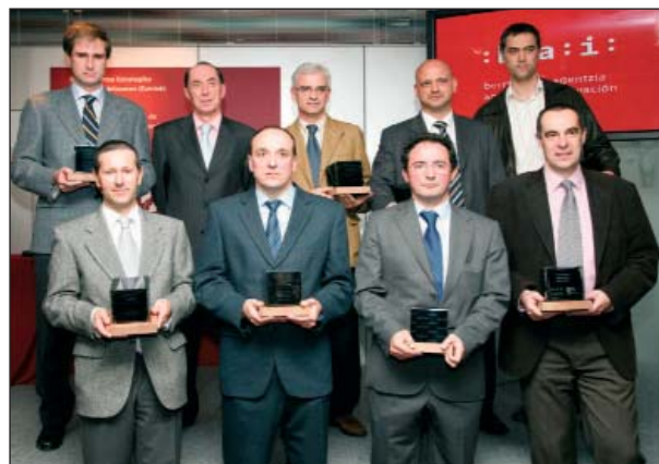
Bizkaiko Zaintza Teknologikoaren eta Adimen Lehiakorraren 5. urteurrenean emandako sarien banaketa

Premie-ren ezarpena eta kalitate, ingurumen eta prebentzioko sistemen ezarpena egin ondoren, eta enpresako zuzendaritzak gogoeta estrategiko sakona