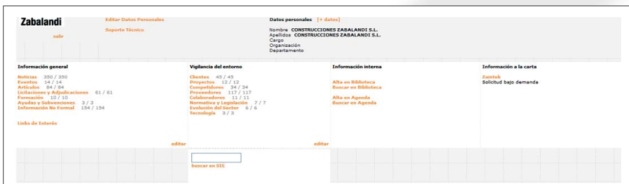
1. irudia: Construcciones Zabalandi-ren Enpresa Informazioko Sistema

Informazioa lortu eta ondo kudeatzeak balio erantsia dakarkio erakundeari gure bezeroen ikuspegitik, eta merkatuan lehiatzeko abantaila ematen dio gai-