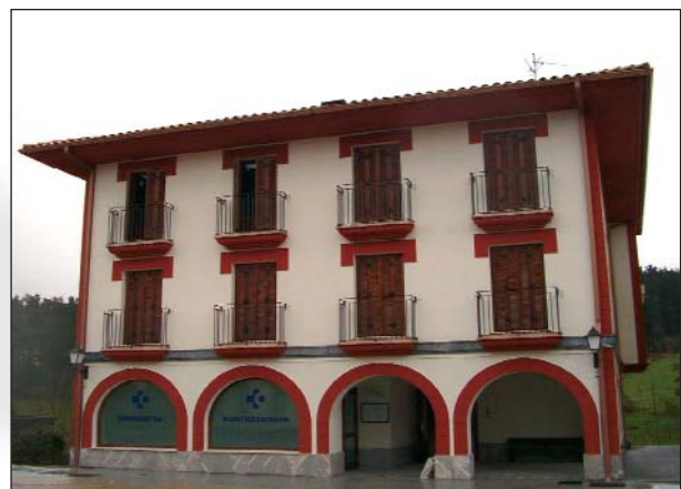
Extebizitzak eta kontsultategia. La Villa, Errigoiti. Bizkaia.

2002an, enpresaren funtsezko aktiboa bezeroak zirela ikusita, lehenetsuna eman zitzaion bezeroen eskaerak eta beharrak osorik asetzeko beharri.