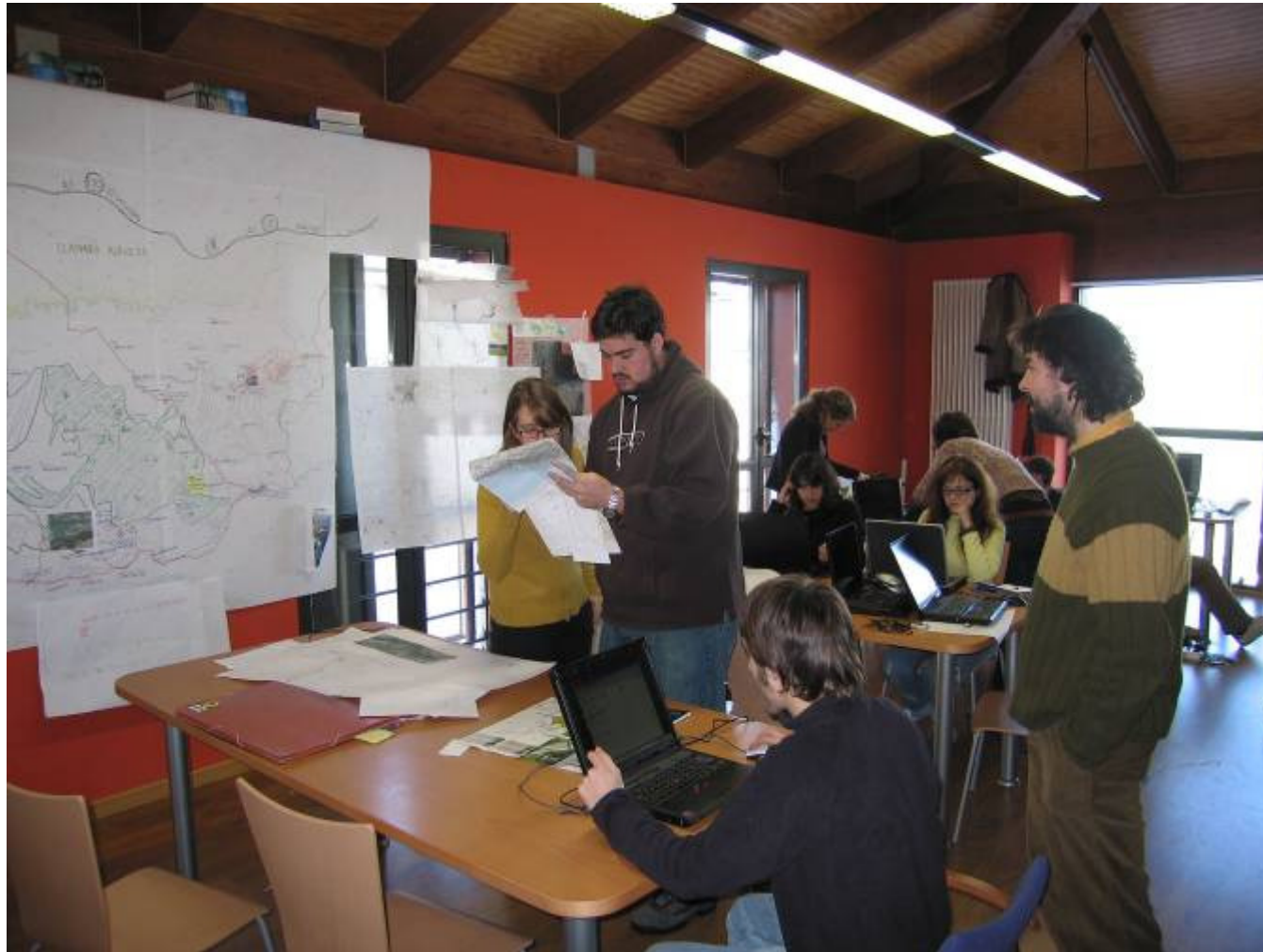
Seminario Urbanismo Inclusivo – Vitoria-Gasteiz – noviembre 2011