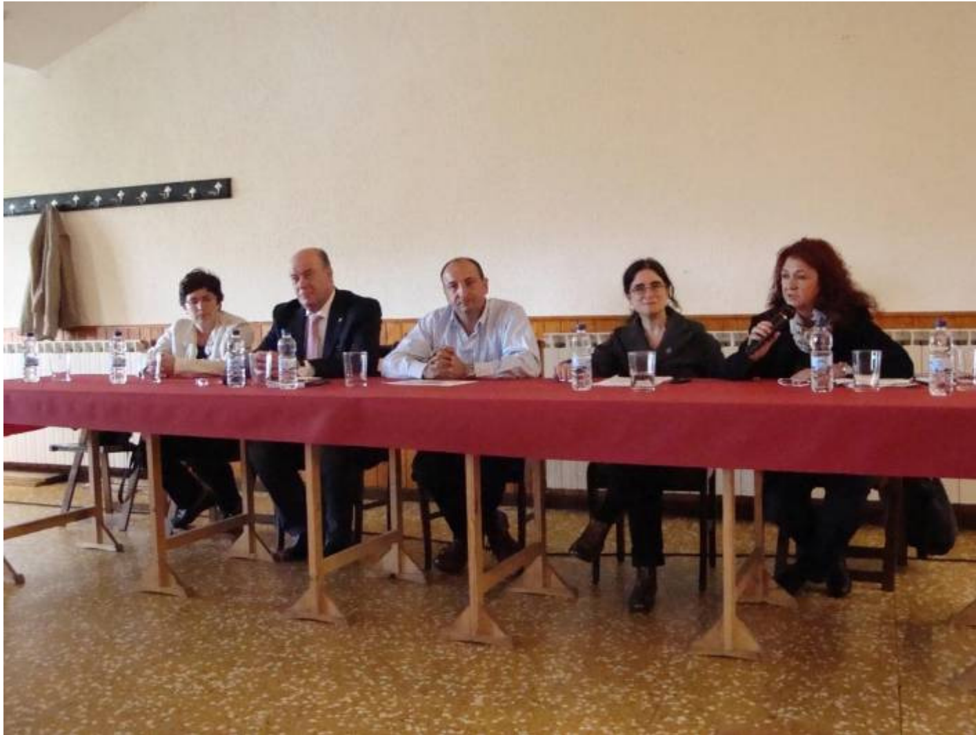
Seminario Urbanismo Inclusivo – Vitoria-Gasteiz – noviembre 2011