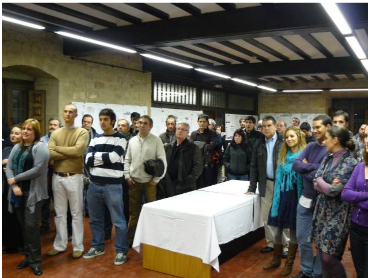
Seminario Urbanismo Inclusivo – Vitoria-Gasteiz – noviembre 2011