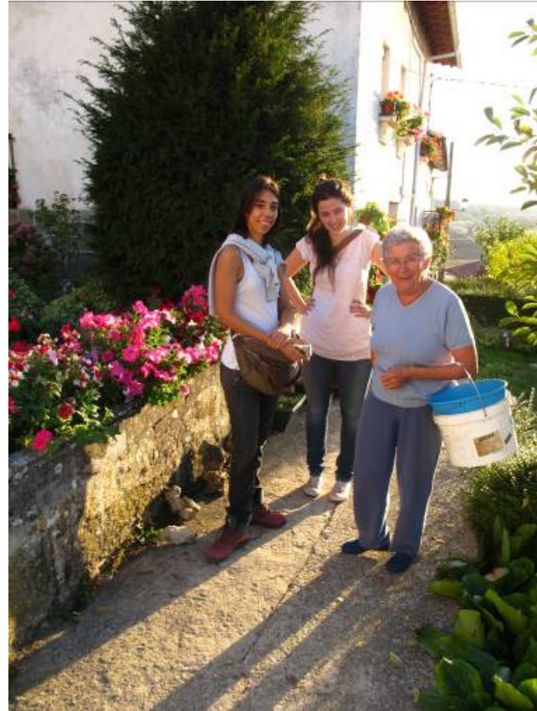
Seminario Urbanismo Inclusivo – Vitoria-Gasteiz – noviembre 2011